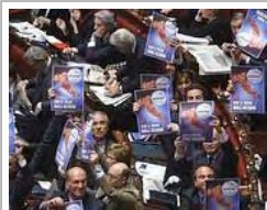
Protesta dell'Idv in aula

Manifestini con il disegno di un'Italia "disidratata". Di Pietro annuncia referendum abrogativo