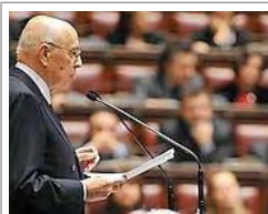
Il presidente della Repubblica Giorgio Napolitano

Berlusconi: «Riforma prioritaria per il governo». L'Anm «La magistratura non è in guerra contro nessuno»